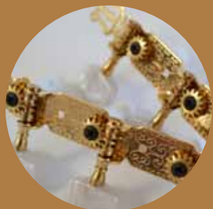
Maquinaria económica y dorada