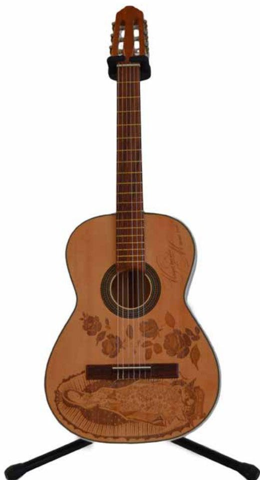
Guitarra Craquelada CLAVE: GCRA