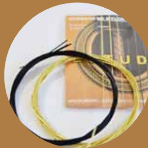
Cuerdas de nylon