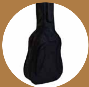
Funda para guitarra reforzada y sencilla