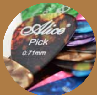
Puas en diferentes calibres