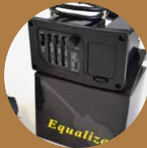
Pastillas de 3 bandas con y sin afinador